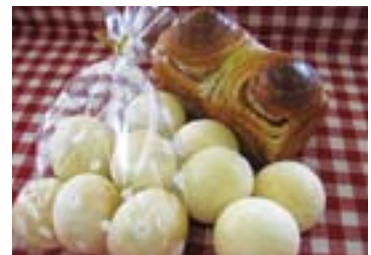
上:メープルブレッド 下:プレミアムプチパン

当方の都合により販売できない場合がございますが、ご了承ください。販売時に見かけた際にはぜひ一度ご賞味ください。