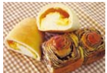
上:たっぷりチーズのフランスパン 下:チョコブレッド